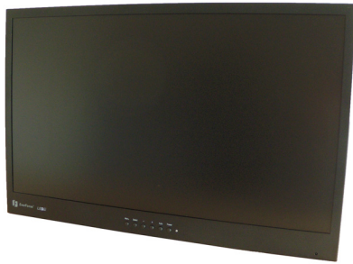
FH 7524 EBLM – 60 cm (23,6") TFT Monitor mit Metallgehäuse und LED Hintergrundbeleuchtung, Full HD